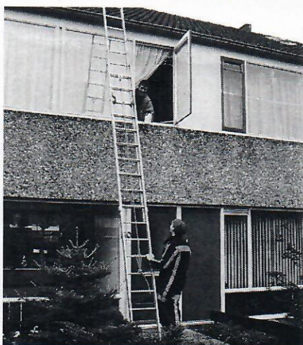
Legaal inbreken met de brandweer om vogels te verzorgen

wij hun vogels of waterschildpadden eten wilden gaan geven. Toen wisten we eigenlijk pas goed, wat er allemaal nog thuis was gebleven. Gelukkig stond bijna alles op de bovenverdieping, maar het was wel thuis. Toen wisten we eigenlijk pas goed wat er allemaal nog thuis was gebleven. Gelukkig stond bijna alles op de bovenverdieping, maar het was wel thuis. Bij een huis waren de duiven gewoon losgelaten in de slaapkamer, fantastisch, niets opgesloten,