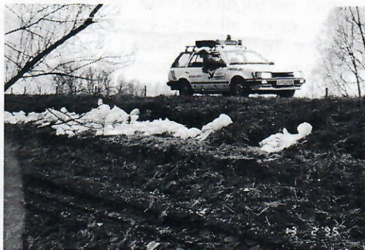
Het water is gezakt, de huizen zijn weer ingericht, de dieren zijn allemaal weer op hun plaats, de zakken zand en de weggeslagen stukken grond herinneren ons er nog aan hoe de situatie hier is geweest.

Uit alle provincie's van het land kregen we wel een reactie. Wij moeten u eerlijk toegeven, dat deze schouderklopjes ons echt goed hebben gedaan. Het gaf ons op momenten dat de vermoeidheid toesloeg en onze emoties soms wat opliepen een echte kick om door te gaan. Wij willen u dan ook hartelijk danken.