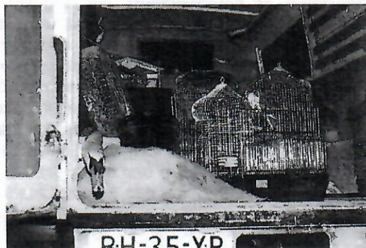
de eerste lading terug in Tiel, incl. onze Alfred.