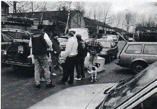
Het af en aan rijden van dieren, de groep van o.a. D.A. Veghel/Uden vangt ze op.